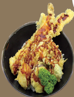
あなご天丼 1,430 円