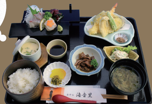
海音里定食 1,800 円