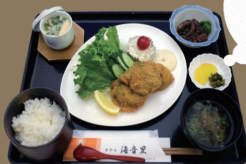
岩ガキフライ定食 時価